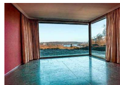
Leicht, locker und modern sollte der Bau sein.