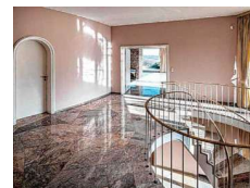
Die Empfangshalle der bereits leergeräumten Villa.