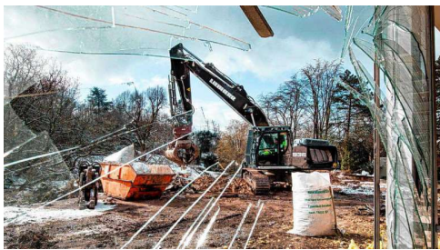
2021 wurde die Beitz-Villa abgerissen.

Christian Niellinger (6) / Fotoarchiv Ruhr Museum