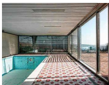
Nachträglich war ein Hallenbad entstanden.